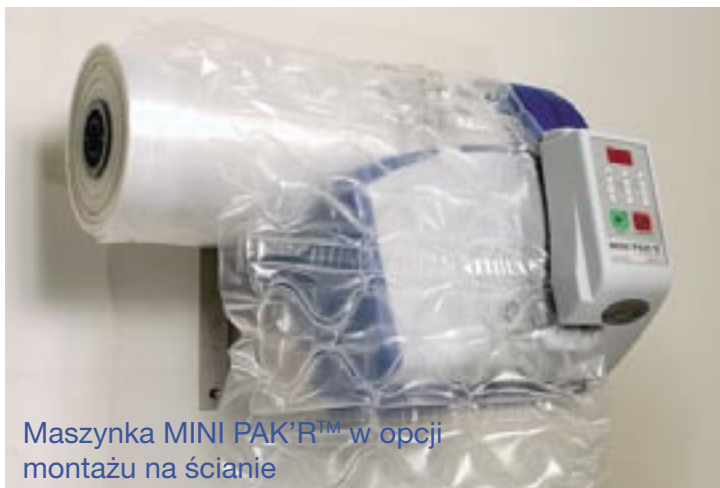
Maszynka MINI PAK'R™ w opcji montażu na ścianie